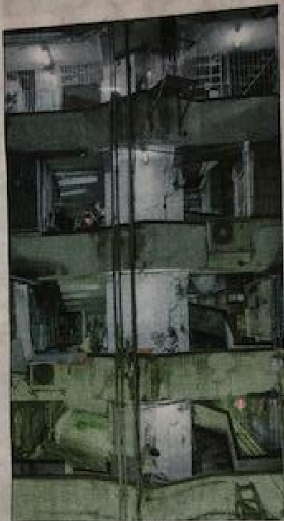
The Taking of a Picture, Sometime Somewhere.

5, (Shang- e van de der de titel ime, So- rt Rotter- galerie beek toont ande mo- Hierop lkaar laten erticaal et hetzelfde ellen. De film lijkt