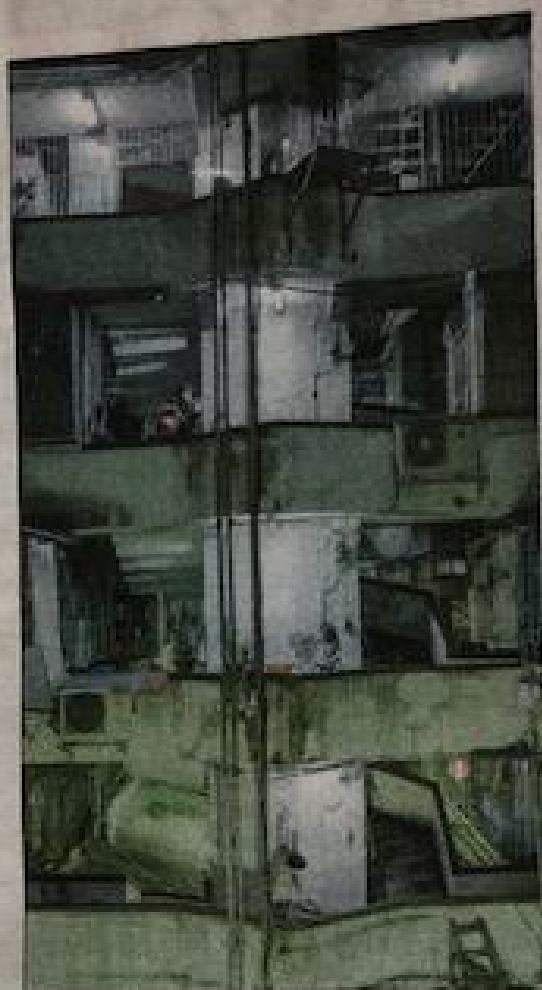
The Taking of a Picture, Sometime Somewhere.

5, (Shang- evan de ler de titel Ime, So- rt Rotter- galerie beek toont ande mo- . Hierop lkaar laten erticaal t hetzelfde ellen. De film lijkt