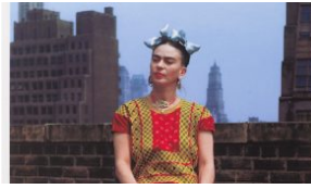
Η Google μόλις άνοιξε μια διαδραστική online έκθεση της Φρίντα Κάλο με πάνω από 800 εκθέματα