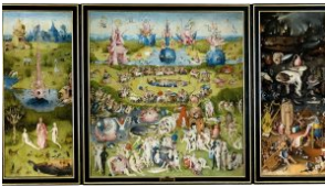
Ο κήπος των επίγειων απολαύσεων: Μία online περιήγηση στους εφιάλτες του Ιερώνυμου Μπος