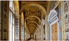
Μία 5ωρη κινηματογραφική βόλτα στο εμβληματικό Μουσείο Ερμιτάζ της Ρωσίας