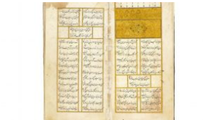
Σε δημοπρασία το πολύτιμο εικονογραφημένο χειρόγραφο του Πέρση ποιητή του 15ου αιώνα Χαφέζ