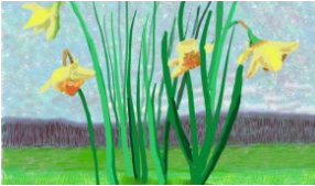
Ένα αισιόδοξο μήνυμα από τον David Hockney: «Δεν μπορούν να ακυρώσουν την άνοιξη»