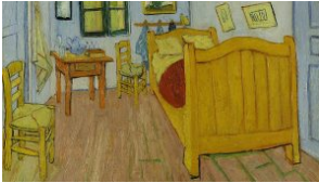
Περιηγηθείτε στο «Υπνοδωμάτιο στην Αρλ» του Βίνσεντ βαν Γκογκ