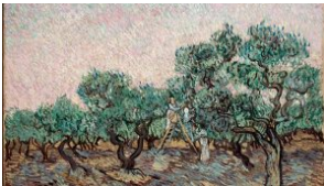
Περιήγηση στη Συλλογή του Ιδρύματος Β&Ε Γουλανδρή από το σπίτι με ψηφιακές αναπαραγωγές έργων και φωνητικές ξεναγήσεις