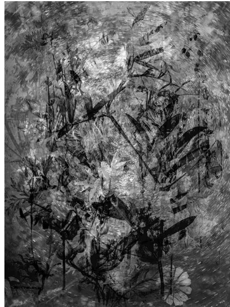
^ Kim Boske, Moving Flowers #3 (2020) , inkjet print mounted in artist frame, 60 x 45 cm

One of the angles of the exhibition in De Pont is the blurring boundaries within the photographic discipline. The work Untitled from the series Moroccan Brides (2010) from the renowned French photographer Valérie Belin is exhibited. Decked out like idols, these Moroccan brides turn into decorative motifs while asserting the irreducible alterity of their presence. With her body wholly disappearing behind the magnificence of her costume, the Fez bride is emblematic of this series. Her heavy, purely ceremonial gown, held in place by a wooden frame, is both literally and figuratively a prison, a symbol of the wife’s subjection. Valérie Belin is one of the most celebrated French photographers working today. Internationally renowned and critically respected, Belin employs the human form as a vessel to project or subvert meaning in her work (source: British Journal of Photography).