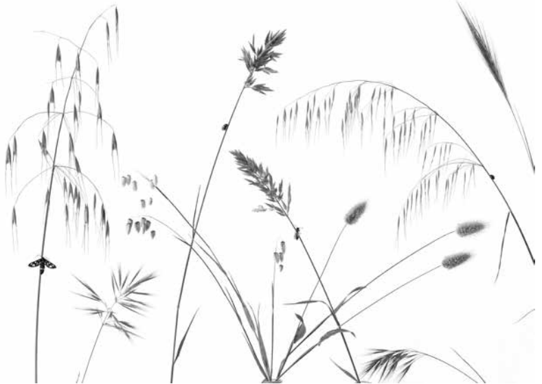
▲ James Mollison, Studies of weeds, number 1, Spongano, Italy, 2020

The new series of Paolo Ventura, G.R. Grazia Ricevuta are inspired by these Ex-Voto -paintings presented in Italian chapels, but represent miracles much more surreal and strange with the same powerful narration than an original Ex Voto. In light of what is happening today, the timing of the creation of Ex Voto, G.R. Grazia Ricevuta is most extraordinary.