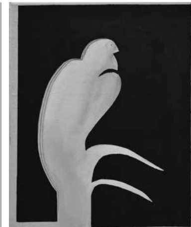
^ Stelios Karamanolis, 'Untitled', colored pencil and acrylic on raw canvas, 2020, 40 x 30 cm

When I'm thinking about making new work it's not like I go into the studio and think 'aha! I'm going to make work about this'. Over a period of time I just thought about those colours, about the surfaces of the rocks, the experiences and expectations of those spaces.(...) I thought about looking into spaces that have unusual darkness or depth, where fear mixes with wonder and your imagination can take over. We were talking earlier about how you find that in caves, in mineshafts, but also just looking down a tube train tunnel. Your perceptual experience becomes secondary and your physical awareness is heightened. (...) In some works I've used collage as a way of creating an additional visual step – such as a mono-print where I've drawn around my hand. It reminds us that this space is an illusion, whereas you, me and the added surface are very much physically present.(...) The hands refer to prehistoric cave painting, connecting to our origins. Not just asking how far back can we go and when did art start, but also conveying the idea of a universal human who existed before nations did. The hands reflect our desire to physically connect. I wanted to touch the cave, but wasn't supposed to. In the same way you might want to touch artworks. We desire to take a bit of it away with us. To some extent that's what the exhibition title 'Found' is referring to. It's not just something seen. It's something found and therefore, perhaps, I own it now. (...)