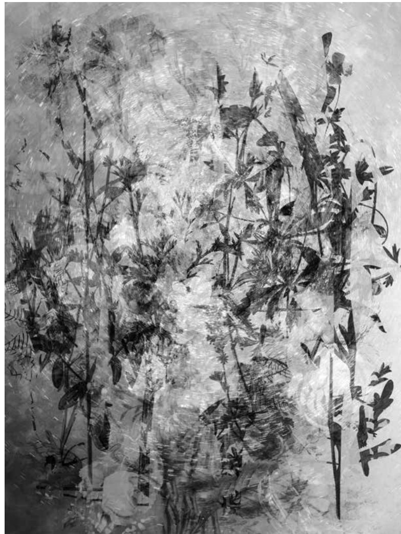
^ Kim Boske, Moving Flowers #1 (2020) , inkjet print mounted in artist frame, 60 x 45 cm

Wat er nu gebeurt brengt me terug bij de essentie van m’n werk. De afgelopen tijd ben ik terug gaan kijken naar mijn werken over de Agui Gawa rivier in Kamiyama, Japan. Hierin speelt de sym-