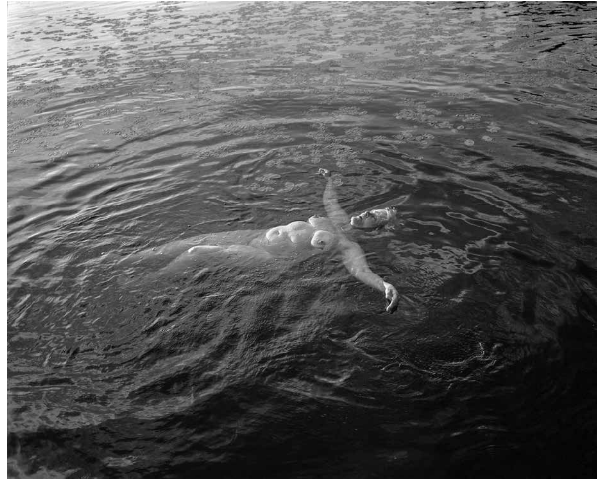
^ Jocelyn Lee, Untitled (Marguerite in harsh light) (2010), canson platine fiber rag paper, 72 x 58

^ Jakup Ferri, Untitled/From the muscle memory (2016), cross-stich, cotton, 102 x 145