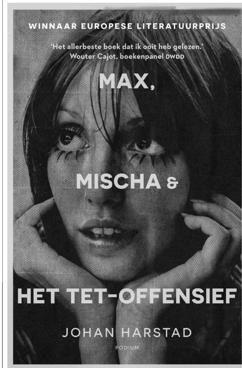
^ Max, Mischa & Het Tet-offensief, Johan Harstad, Uitgeverij Podium, 2017

met Sofia Goebaidolina en Oestvolkskaja, en Claude Vivier? Van de VPRO. Moet je maar eens kijken. Trouwens laatst heb ik die film gezien, The Talented Mr. Ripley, maar met Alain Delon in de jaren 1960; die is natuurlijk veel echter, dan nu met Matt Damon, Jude Law, Kate Blanchett en hoe heet die andere blonde... Hier speelt Delon Tom Ripley; hoe heet die andere nou; Sliding Doors... Gwyneth Paltrow! Ik moet je dat stukje even laten zien, straks, met Sissi, Romy Schneider. Je moet het even zien.”